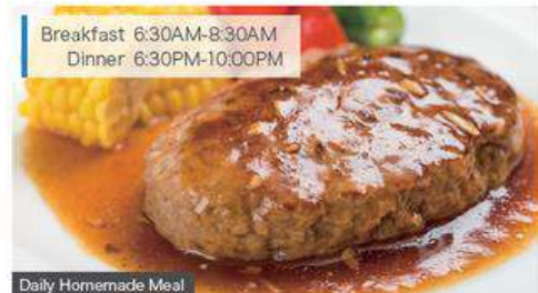
Breakfast 6:30AM-8:30AM Dinner 6:30PM-10:00PM

※Except designated holidays such as Sundays, public holidays, summer and winter holiday.