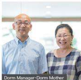
Dorm Manager-Dorm Mother